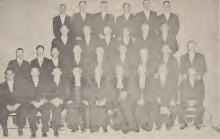
Kerkraad met die inwyding van die huidige kerkgebou, 12 April 1958.